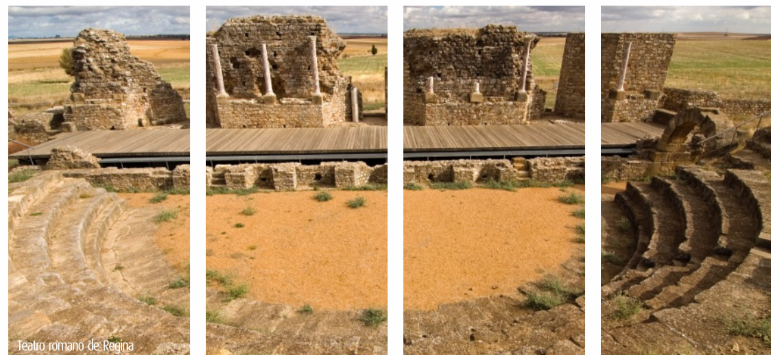
Teatro romano de Regina