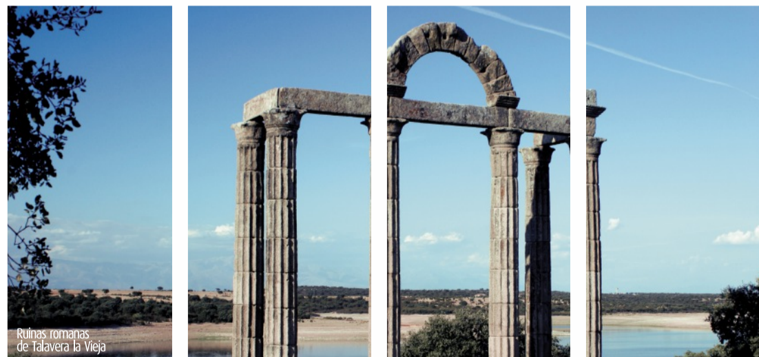
Ruinas romanas de Talavera la Vieja